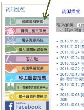
b) 學科用書：主題分類