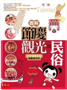
圖解節慶觀光與民俗：SOP標準流程與案例分析 / 方偉達作。五南出版，2016。