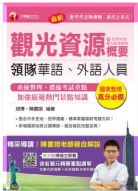
觀光資源概要(包括世界史地、觀光資源維護) / 邱燁，陳書翊編著。千華數位文化，2017。